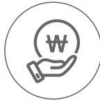
점점 인상되는 처리비용