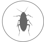
보관으로 인한 벌레꼬임